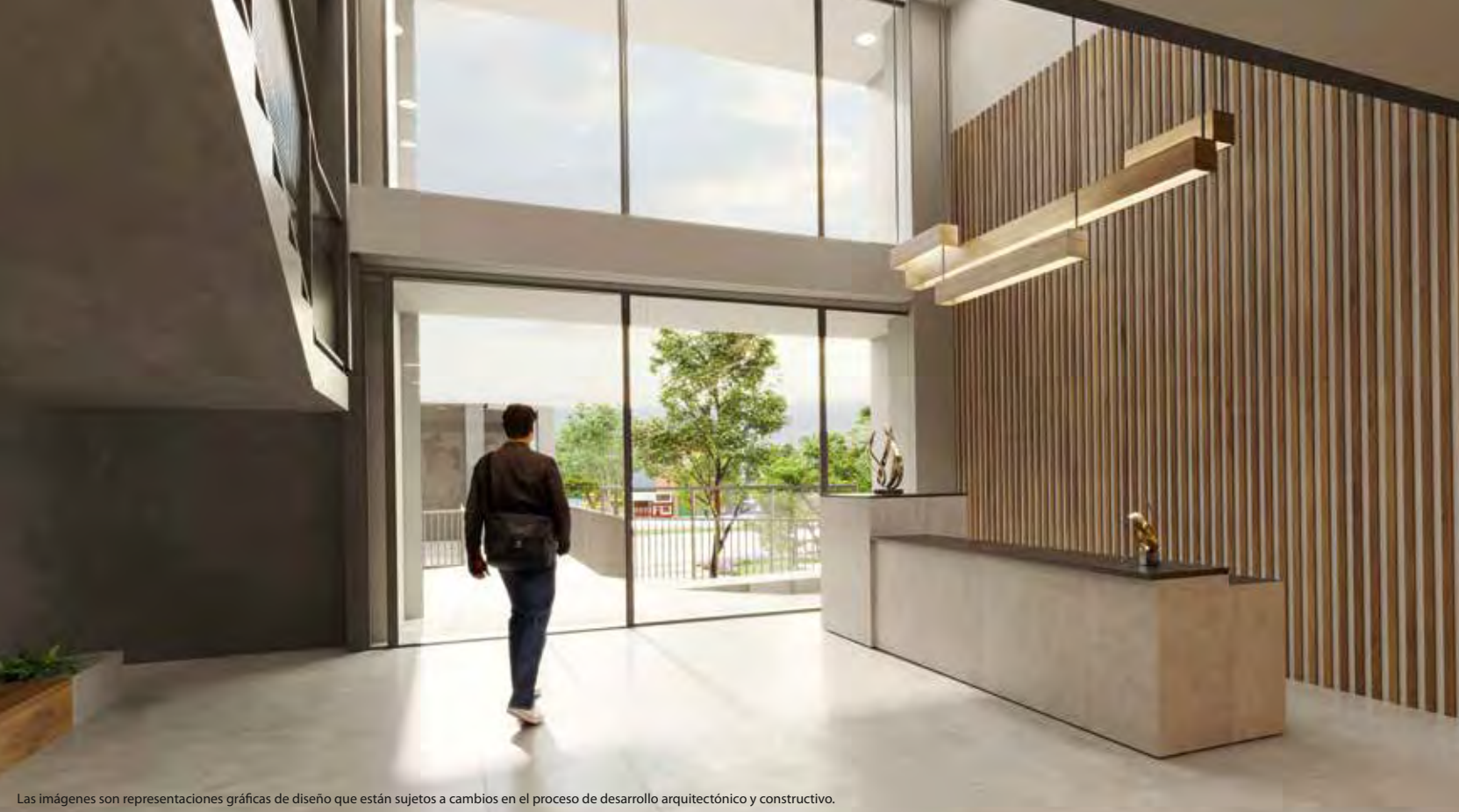
Las imágenes son representaciones gráficas de diseño que están sujetas a cambios en el proceso de desarrollo arquitectónico y constructivo.