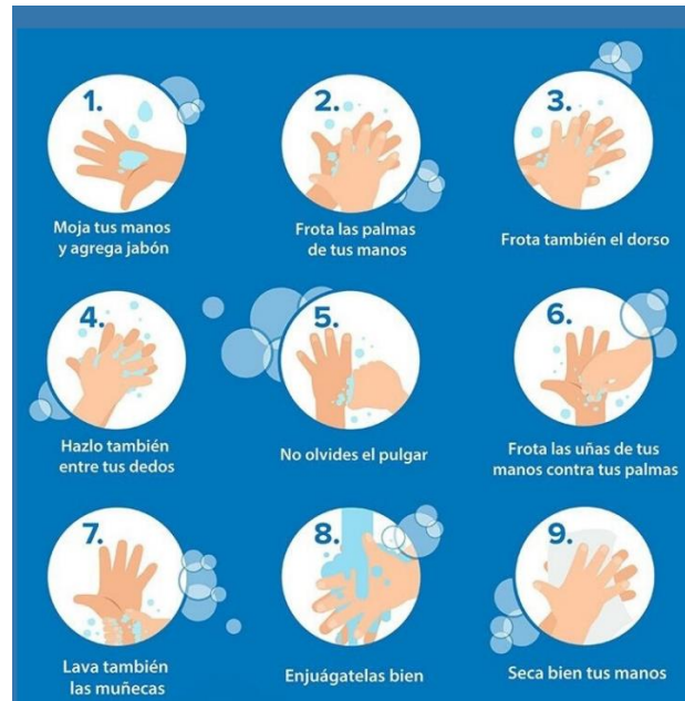
Recomendaciones Lavado de manos